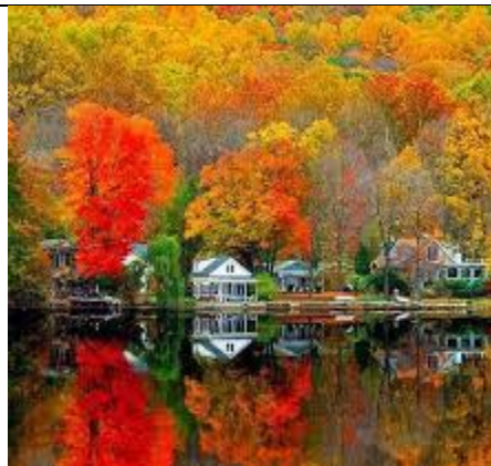
TRANH TRONG BẢO TÀNG MÙA ĐÔNG