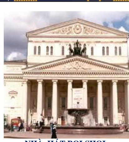
NHÀ HÁT BOLSHOI