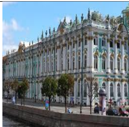
BẢO TÀNG MÙA ĐÔNG

19h00: Quý khách dùng bữa tối tại nhà hàng địa phương, sau đó xe và HDV đưa về khách sạn 4* nghỉ ngơi. Nghỉ đêm tại St. Petersburgs.